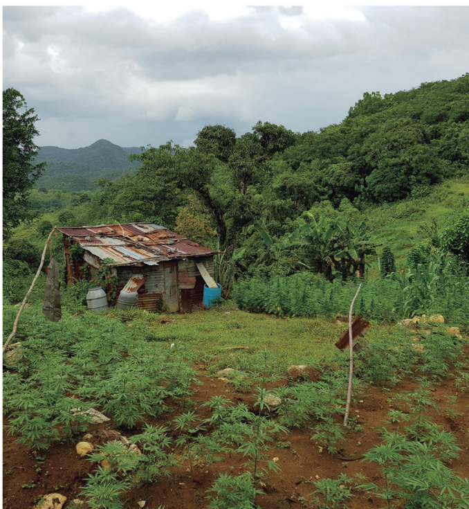
Illicit cannabis cultivation, Jamaica. TNI/Martin Jelsma August 2018

casi nada fue exportado. La cuota subutilizada de Colombia en 2018 fue transferida para el siguiente año por el sistema administrativo de la JIFE.