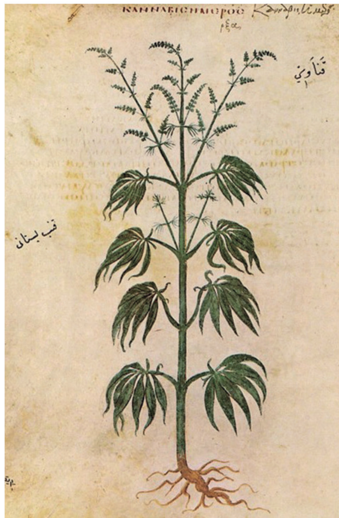
Ilustración del año 512 AD Vienna edición de De Materia Medica por Pedanius Dioscorides (40–90 AD). Colección Hash, Marihuana & Hemp Museo Amsterdam/Barcelona

de 45.000 toneladas métricas de flores de cannabis y 7.500 toneladas métricas de resina. Pero la conclusión principal fue que 'pocos gobiernos pueden dar un estimado confiable de la proporción de cultivos en sus propios países. [...] Incluso si el número de hectáreas de cultivo de cannabis estuviera documentado, hay pocos estudios acerca de cuánta droga producen esos campos por cosecha. Como resultado, el estimado de la producción global permanece altamente tentativo 69 '. El Informe Mundial de Drogas de 2009 menciona un rango de entre 13.300 a 66.100 toneladas métricas de flor y entre 2.200 y 9.900 toneladas métricas de resina 70 .