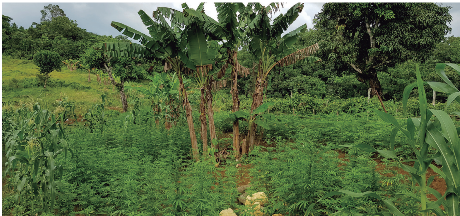
Cultivo de cannabis ilegal, Jamaica. Agosto 2018