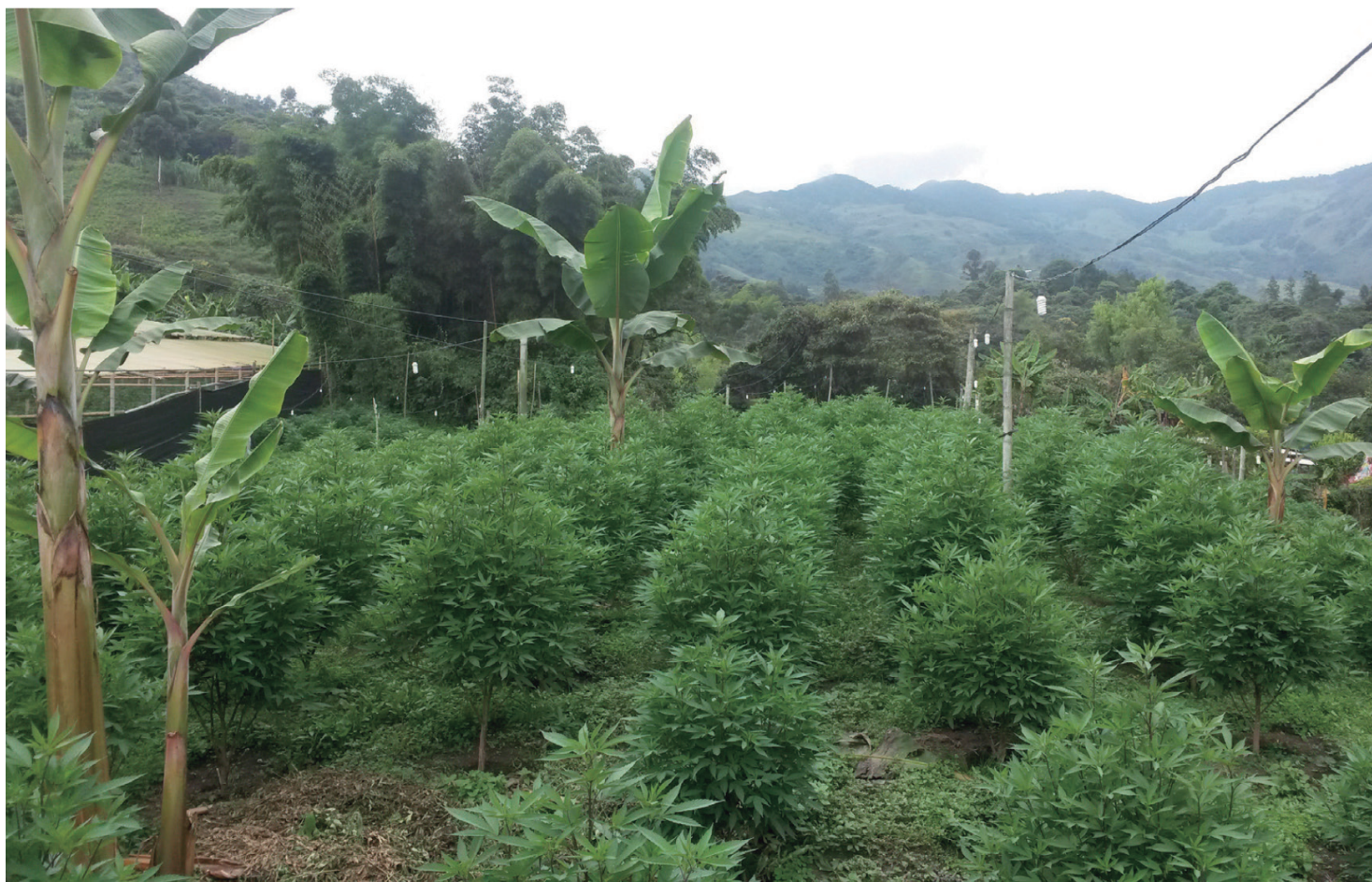
Cultivo de cannabis ilegal, Cauca, Colombia. Junio 2017

¿Será posible ver aparecer un modelo de cannabis apoyado por la comunidad (CAC)? En un sentido formal menos codificado, esta es la realidad para las comunidades cultivadoras alrededor del mundo en donde la producción y el uso del cannabis están arraigados a un conjunto de relaciones particulares a un lugar. En Jamaica, por ejemplo, en donde ha habido una larga historia de uso tradicional de la ganja como parte de la identidad religiosa y espiritual de las comunidades Rastafari y Maroon, las comunidades de productores y consumidores son muy cercanas, si no las mismas.