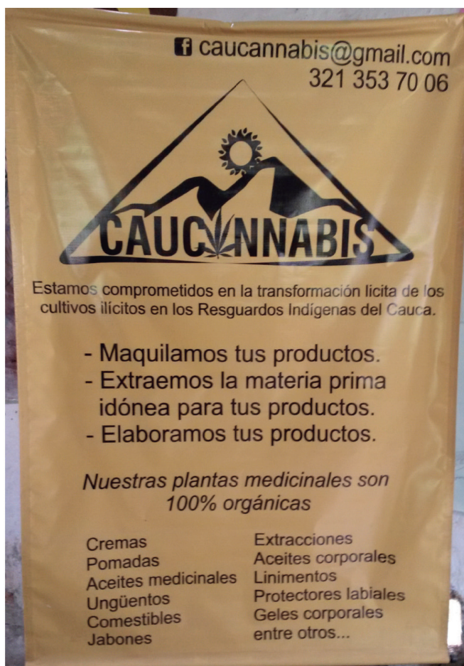
Bandera de la asociación Caucannabis TNI/Martin Jelsma Junio 2017

los altos estándares requeridos por el mercado legal están completamente fuera de su alcance, incluso agrupados como cooperativas. Necesitan leyes públicas de apoyo, inversiones y asistencia técnica para poder triunfar (ver abajo). También hay muchos ejemplos de cooperativas que han fracasado o que han empleado estructuras deficientes en la toma de decisiones haciendo que sea importante no ver las cooperativas como la panacea a los problemas culturales y económicos que tienen raíces sociales más profundas.