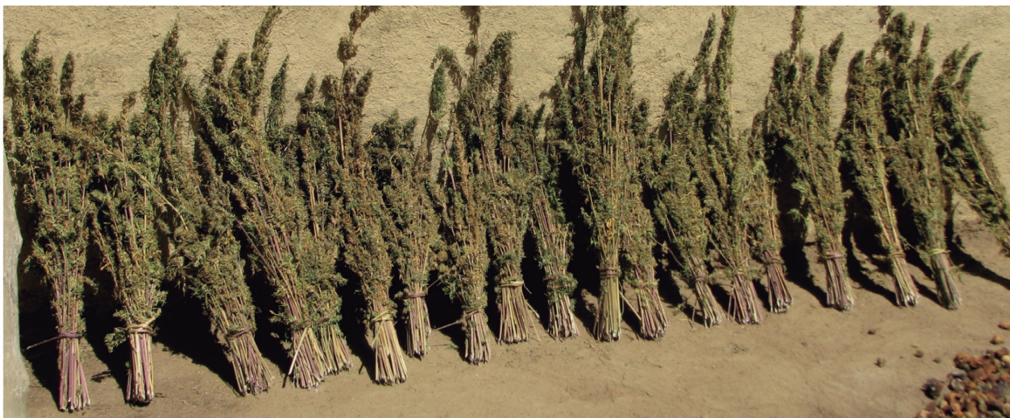
Secado de cannabis cosechado, Rif, Marruecos. TNI/Pien Metaal Julio 2009

países con buenos recursos para los sistemas sofisticados de monitoreo luchan para tener estimados creíbles del alcance del cultivo doméstico de cannabis 71 . También son una gran incógnita países grandes como Rusia (en donde se dice que el 70 por ciento del cannabis que se consume es de producción local), India (con una antigua tradición de cannabis en muchos estados) y China.