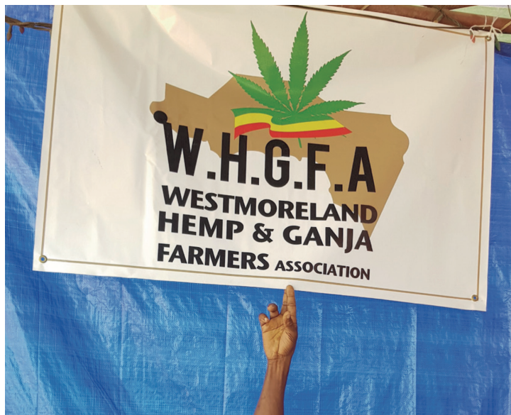
Bandera de la asociación de granjeros jamaquinos Agosto 2018

Mientras el 'desarrollo alternativo' se convierte en un asunto importante de debate en las Naciones Unidas para la coca y la amapola, solo un puñado de estos proyectos ha sido establecido para los cultivadores de cannabis. Solo en el Líbano, Marruecos (ver abajo), Indonesia y Filipinas, se ha implementado, aunque ninguno de ellos ha sido exitoso. Los insistentes llamados a la comunidad de donantes internacionales, especialmente desde los países africanos, por más inversión para el desarrollo en su área han caído en oídos sordos: nadie cree realmente que pueda funcionar en el caso del cannabis ni ocupa un lugar importante en la agenda política. Sin embargo, la reciente tendencia regulatoria ofrece una perspectiva completamente nueva al proporcionar alternativas de subsistencia para los campesinos actualmente involucrados con la economía ilícita del cannabis.