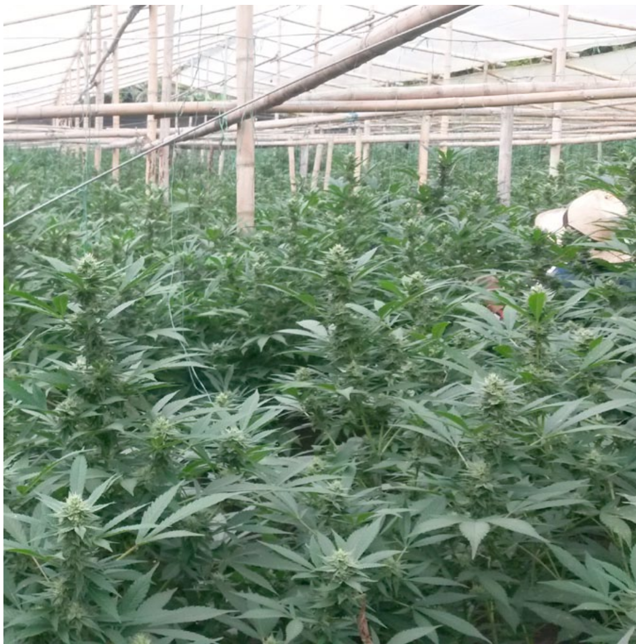
Cannabis in a greenhouse.

En la primera parte el texto hace una revisión breve de la historia reciente de la marihuana y su uso en Colombia. Luego se centra en la evolución legislativa que desembocó en la Ley 1787 de 2016. En la tercera parte se analiza de fondo las implicaciones de la ley, los tipos de licencia y las resoluciones subsiguientes. A continuación se presenta un panorama de la situación actual del negocio de cannabis, las empresas que hacen parte y el papel del pequeño y mediano campesinado. Y la última parte ofrece sugerencias de cómo esta legislación podría beneficiar en mayor parte a los primeros eslabones de esta cadena, que no sólo han sido quienes más han sufrido los embates del narcotráfico sino también los problemas relacionados con la repartición de tierras.