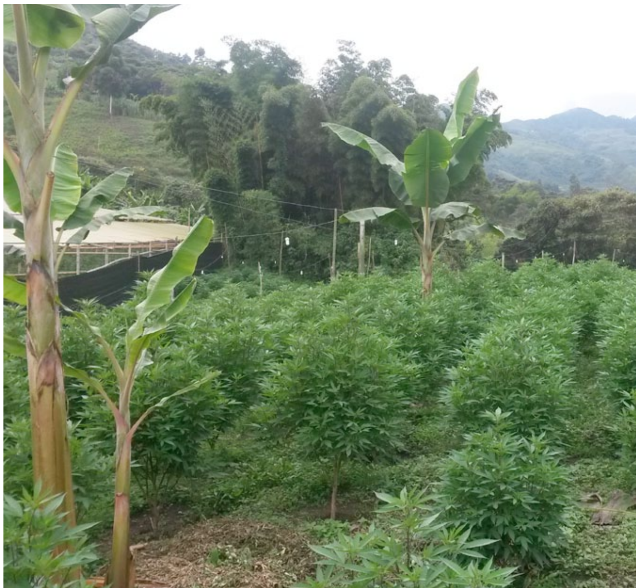
Cannabis